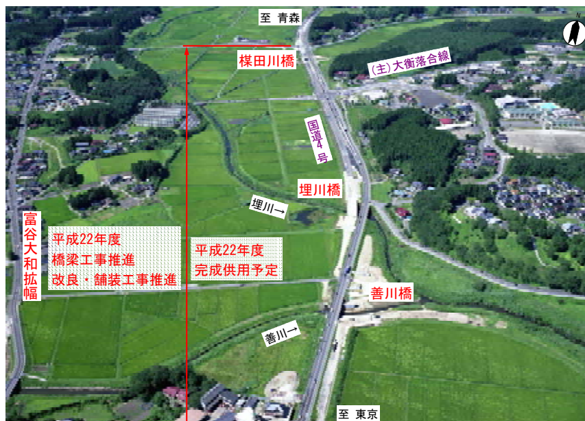
▲富谷大和拡幅(大衡村)上空写真