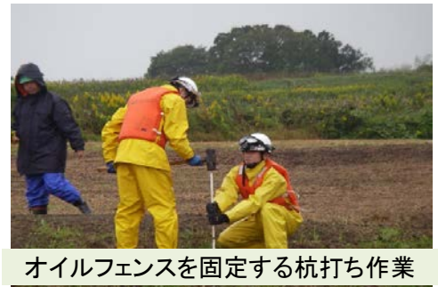
オイルフェンスを固定する杭打ち作業