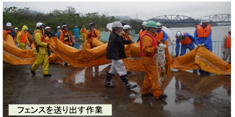
フェンスを送り出す作業