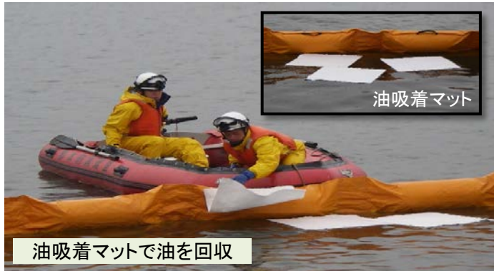
油吸着マットで油を回収