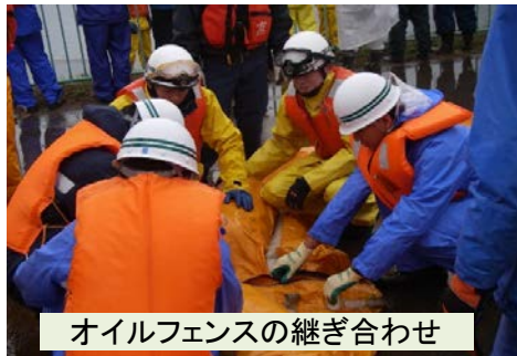
オイルフェンスの継ぎ合わせ