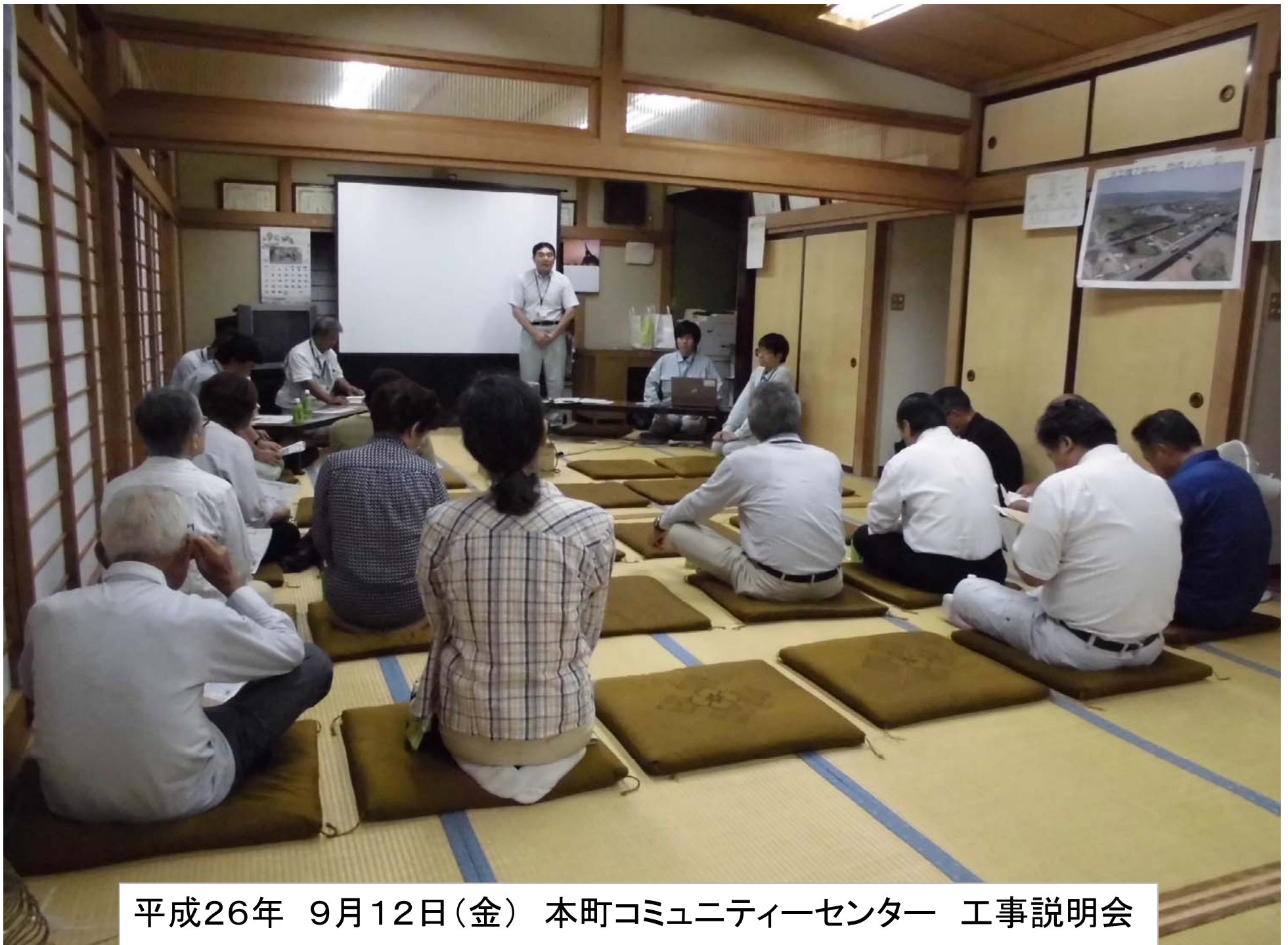
平成26年 9月12日(金) 本町コミュニティーセンター 工事説明会