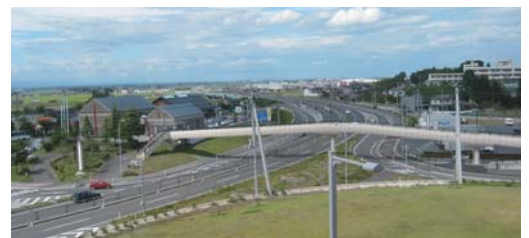
国道4号 三本木古川拡幅供用区間(大崎市三本木)