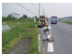
通行に支障になる落下物を回収します