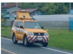
毎日のパトロールで道路の安全を図ります