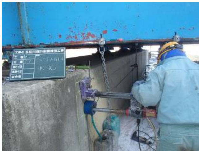
コンクリート削孔状況 (P1)