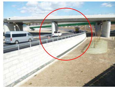
③ 南宮地区 Bランプ付近