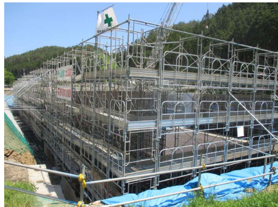
▲No.277北側から本線側を望む