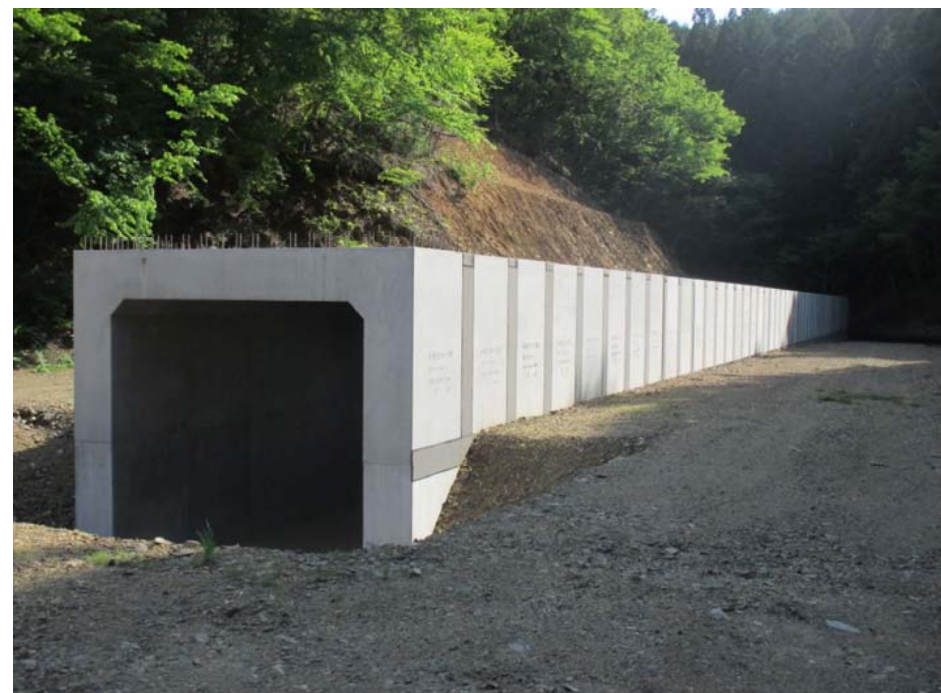
▲No.219東側から本線側を望む