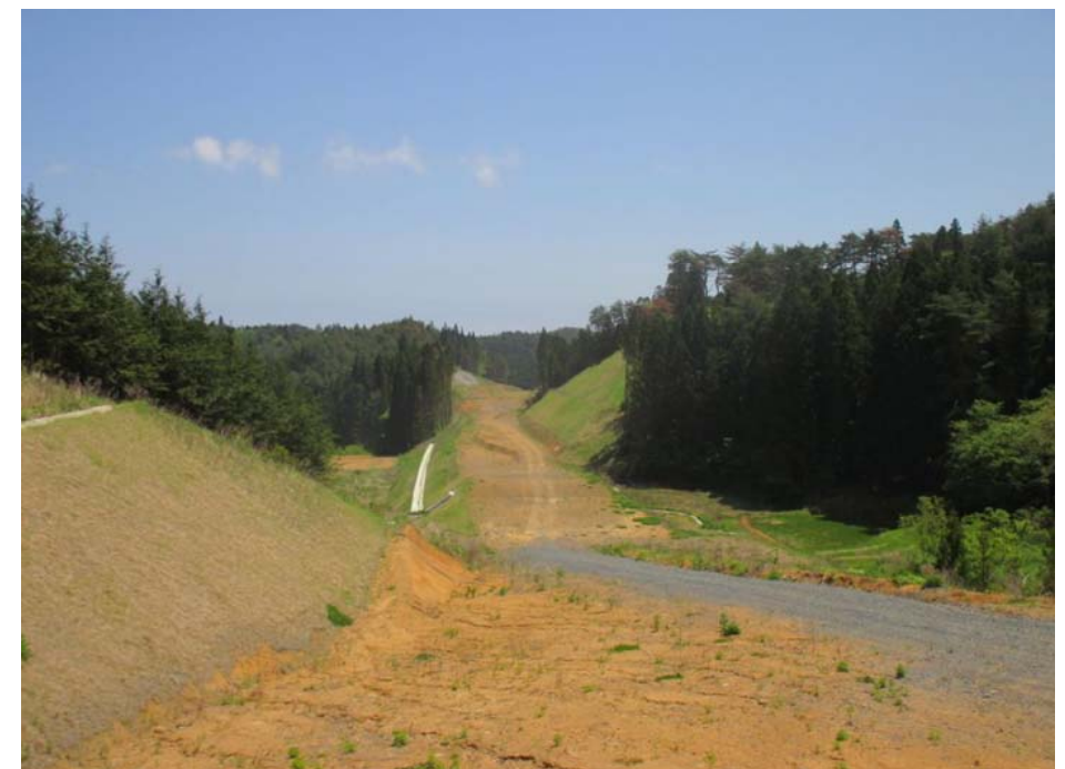
▲No.317から起点側を望む

伊里前川南地区道路改良工事 受注者：泰昌建設株式会社 工期：H28.4.1～H29.2.24