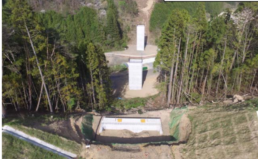
① A1側からP2側を望む (仮)立沢川橋下部工