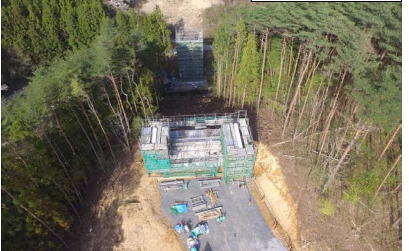
④ 終点側から起点側を望む (仮)蛇王川橋下部工