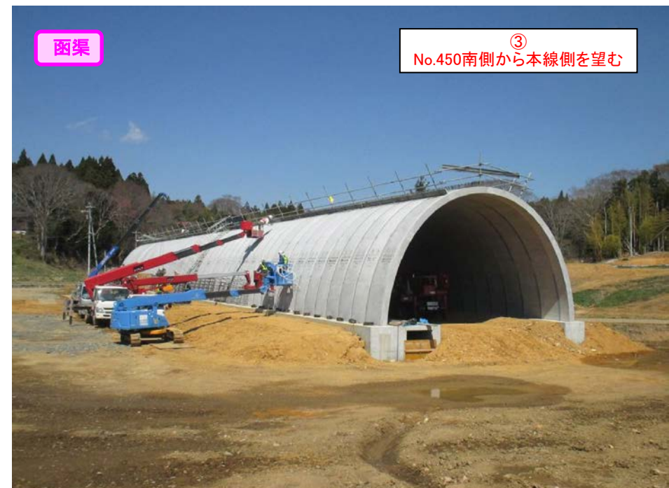
函渠 ③ No.450南側から本線側を望む