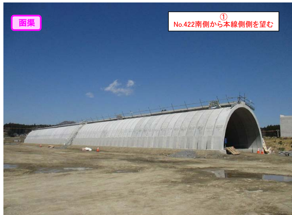
函渠 ① No.422南側から本線側を望む