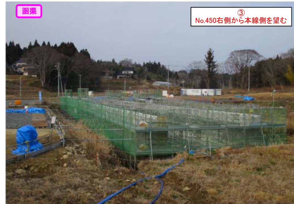
③ No.450右側から本線側を望む