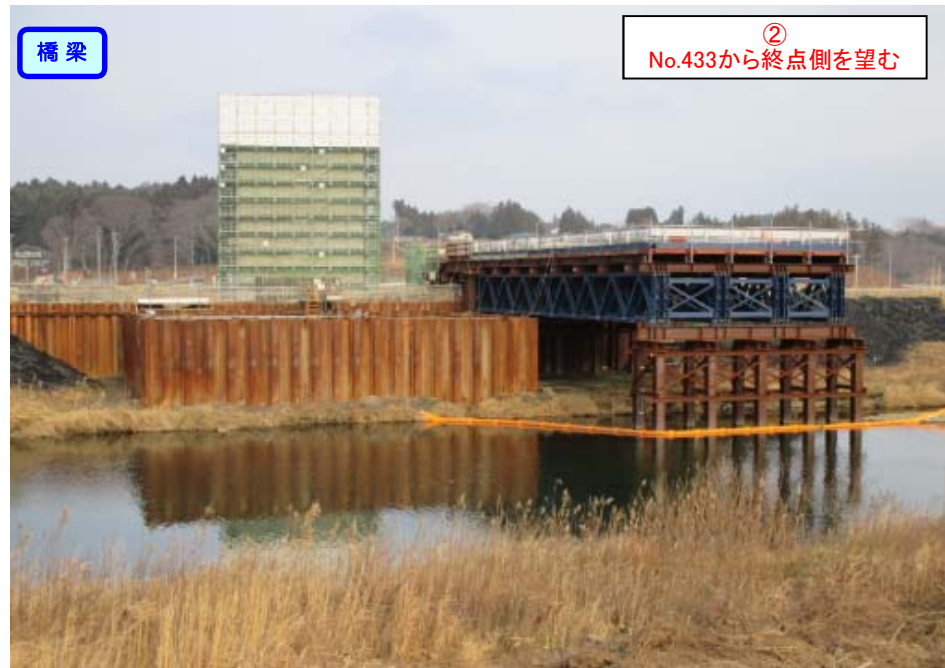
② No.433から終点側を望む