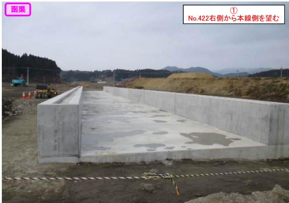
① No.422右側から本線側を望む