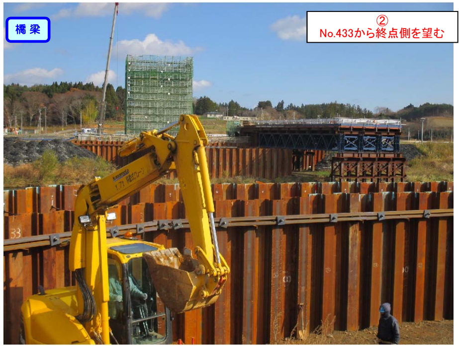
② No.433から終点側を望む