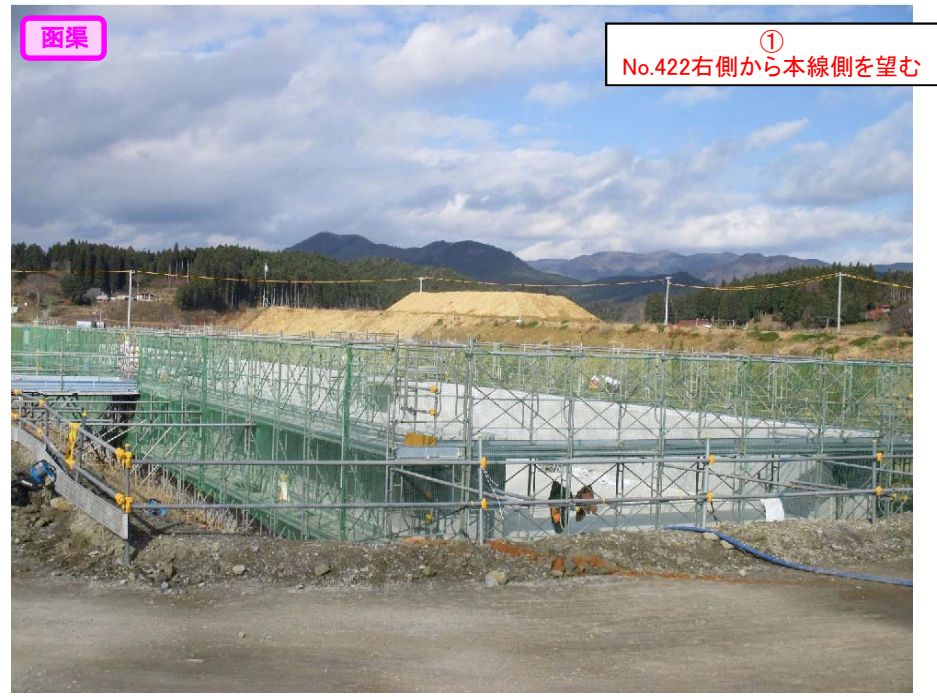
① No.422右側から本線側を望む