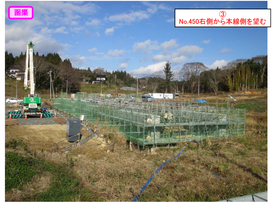
③ No.450右側から本線側を望む