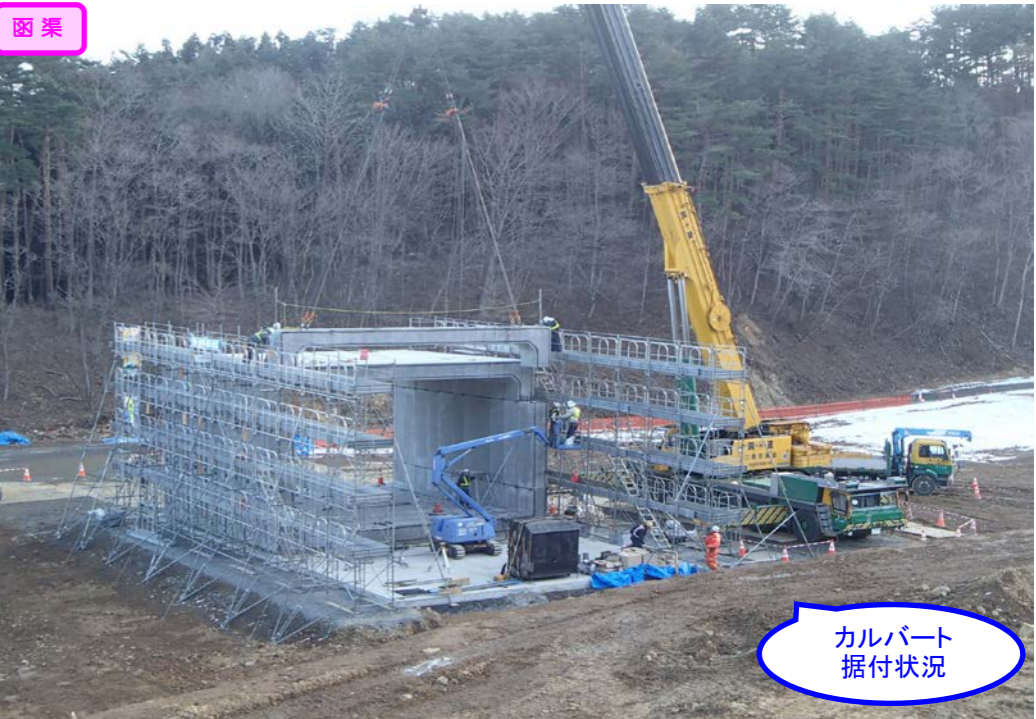
カルバート据付状況