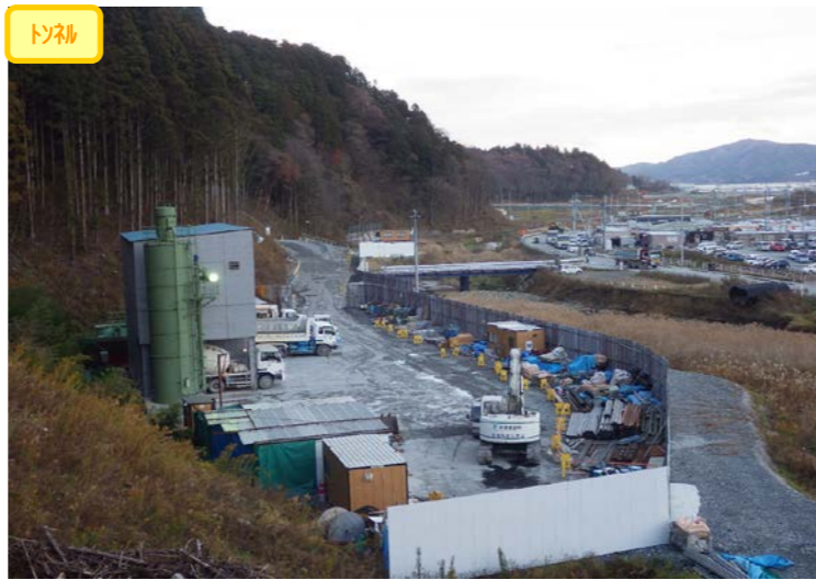
① 南三陸道路1号トンネル 仮設備ヤード