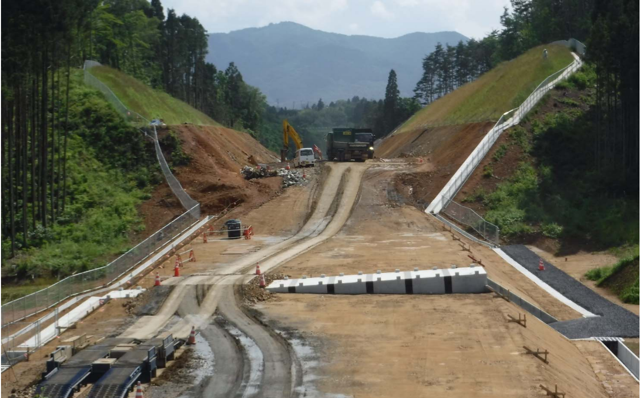
▲No.58から起点側を望む