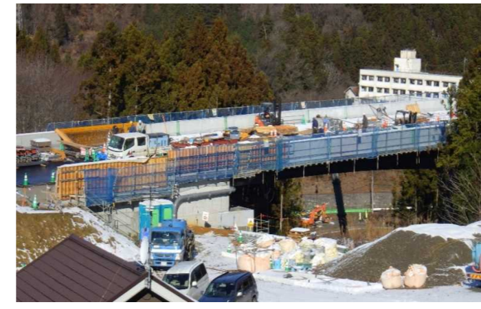
▲No285から終点側を望む [大峠山橋(仮)]