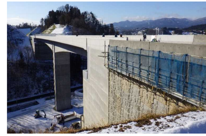
▲No271から終点側を望む [鹿折橋(仮)]