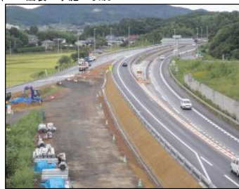
⑪ Bランプ No.-33より三陸道石巻方向 舗装工事施工状況