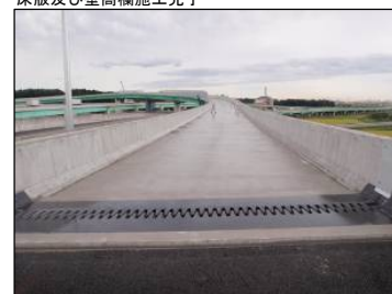
⑬ Bランプ No.-14より起点方向 床版及び壁高欄施工完了