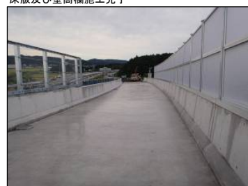
⑯ Bランプ No.-33より起点方向 床版及び壁高欄施工完了