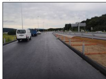
⑥ Cランプ No.-38より起点方向 舗装工事施工状況