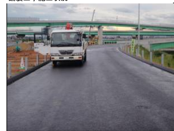
⑤ Cランプ No.-38より終点方向 舗装工事施工状況