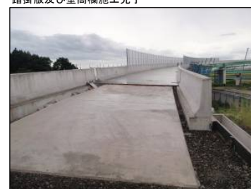
⑰ Bランプ BA1橋台背面から終点方向 踏掛版及び壁高欄施工完了