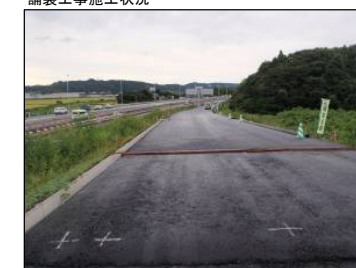
⑱ Bランプ No.-43より起点方向 舗装工事施工状況