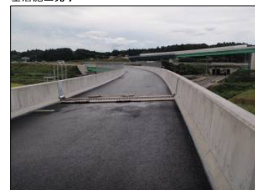
② Cランプ No.-23より起点方向 基層施工完了