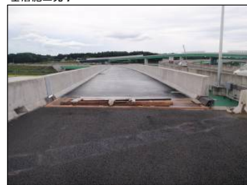
① Cランプ No.-15より起点方向 基層施工完了