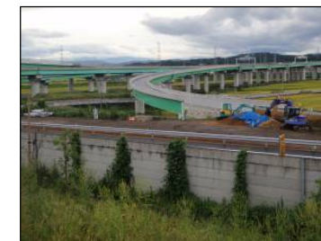
⑩ Cランプ Bランプより北部道路方向