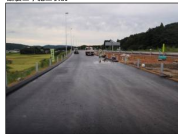
④ Cランプ No.-35より起点方向 舗装工事施工状況