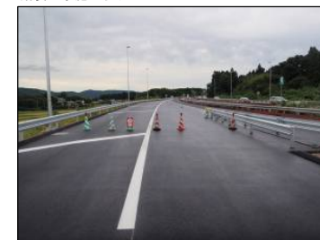
⑧ Cランプ No.-42より起点方向 舗装工事施工状況