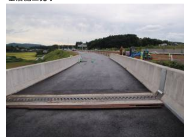
③ Cランプ CA1橋台より起点方向 基層施工完了