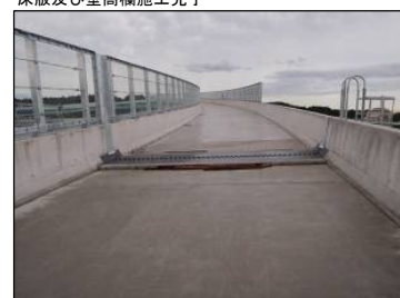
⑭ Bランプ No.-20より起点方向 床版及び壁高欄施工完了