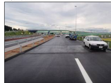
⑦ Cランプ No.-42より終点方向 舗装工事施工状況