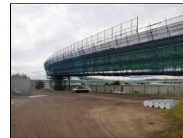
⑫ Bランプ BA1橋台より終点方向