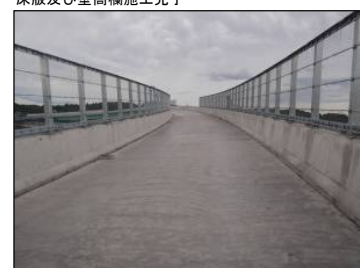
⑮ Bランプ No.-24より起点方向 床版及び壁高欄施工完了