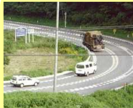
通岡峠の線形不良箇所