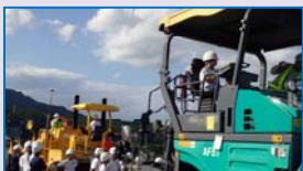
舗装を行う大型機械に試乗