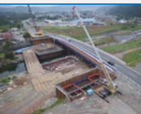
国道45号豊間根橋下部工撤去