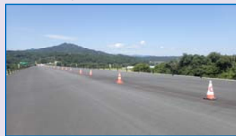
駅伝コースの一部 豊間根地区の景色が満喫できます

10月1日(日)に、三陸沿岸道路『山田宮古道路』をコースに『第33回町民駅伝大会』が、開催されます。毎年一般道路を使って行われる大会を今回は山田宮古道路の開通を記念して、完成間近の道路で開催するものです。豊間根地区の山田第2トンネル(仮称)～豊間根川橋(仮称)間で、開通したら走ることのできないコースで景色を満喫しながら、快走します。