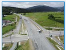
道路改良工事(山田北IC(仮))