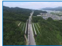
道路改良(沼里地区)