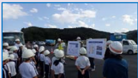
復興道路の効果などを学習

9月13日(水)山田町立荒川小学校の第1～第6学年児童29名と教職員6名が豊間根付近の現場を見学しました。復興道路工事現場の見学をしたり、説明を聞いたりすることで、復旧・復興への歩みを知り、また道路の果たす役割や効果について理解する。という校外学習の一環で行ったものです。舗装中の現場で、パネルによる復興道路の役割や効果などを熱心に学習した後、舗装を行う機械の試乗を体験しました。大きい！高い！など感嘆の声も聞かれ、心に残る学習になったものと思います。