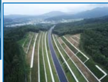
道路改良工事(石畔地区)

本工事は、山田町豊間根から宮古市津軽石間の延長2kmの工事で、平成27年5月から工事を開始し、平成29年8月に完了しました。約28ヶ月の工事期間中、多数のダンプトラックの往来で地域の皆様に大変ご迷惑をお掛けしましたが、ご理解とご協力をいただき、おかげ様で完成することができました。工事期間中、弘川地区での小中学生の通学時の横断歩道での安全見守りなどの活動を通じて地域の皆様と一緒に復興の道のりを感じられたのは、よい思い出となりました。開通を迎え、復興及び発展がより進みますよう心よりお祈り申し上げます。