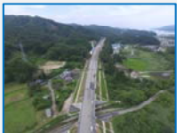
道路改良(根井沢地区)

平成27年11月から津軽石地区で道路改良工事を開始し、平成29年8月に完了しました。工事中は、津軽石町内をダンプトラックが多数往来し地域の皆様に大変ご迷惑をお掛けしました。地域の皆様のご理解とご協力をいただき無事に完了することができました。三陸沿岸道路が開通して地域がますます発展しますよう心からお祈り申し上げます。