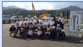
三陸道路の路面で記念の1枚