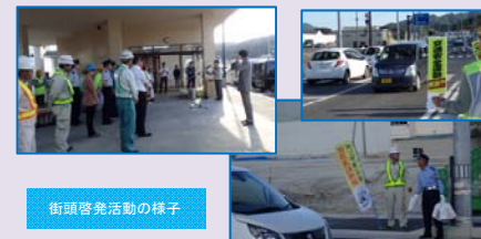
街頭啓発活動の様子

『平成29年度秋の全国交通安全運動』初日の9月21日(木)山田町まちなか交流センター及び付近の国道45号で行われた街頭啓発活動に山田宮古道路安全連絡協議会会員15名も参加し、安全標語ののぼり旗の掲示や啓発グッズの配布を行いました。工事の関係車両も多く、あらためて交通事故防止を肝に銘じて事業を進めることを決意しました。『命を守る早めのライトと反射材！』