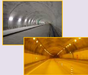
※写真は内装板設置のイメージです