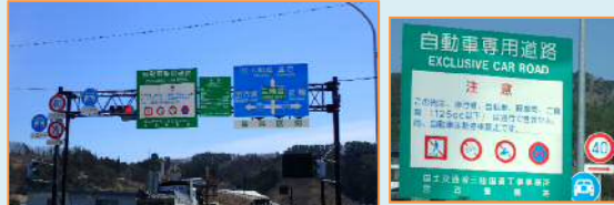
※写真は、標識設置のイメージです