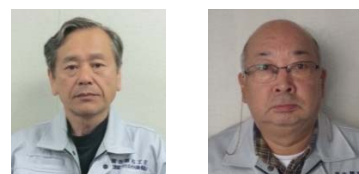
いたん伊丹担当技術者 伊藤担当技術者

PPP（パブリック プライベート パートナーシップ）は、文字どおり、官と民がパートナーを組んで行う事業であり、私たちは民間の会社で構成されてます。その中で施工監理とは、地元及び関係機関との協議や設計・施工の監督・監理する仕事になります。