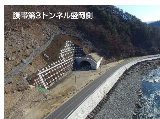
腹帯第3トンネル盛岡側