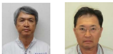
鈴木主任技術者 ひらこおり平部専門技術者