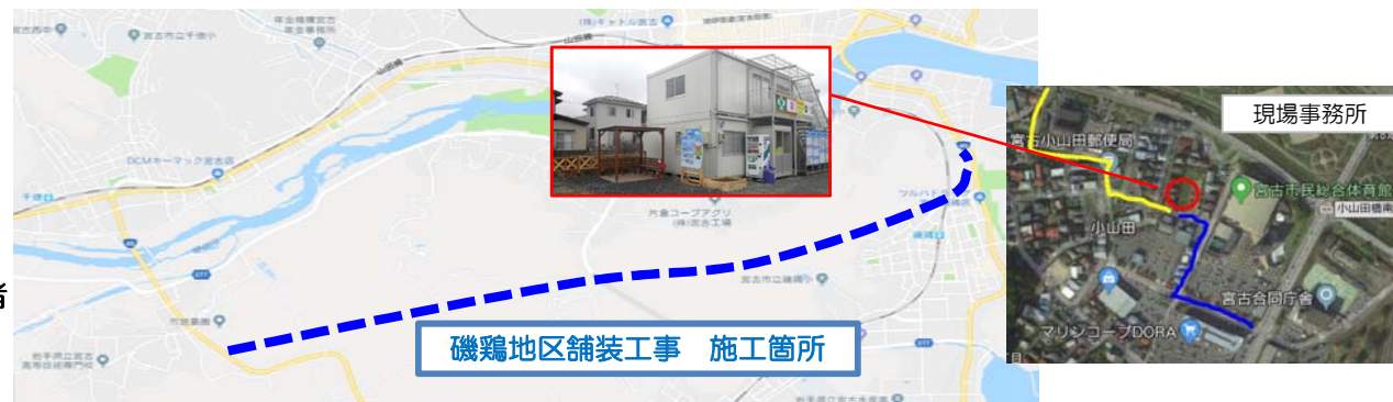
磯鶏地区舗装工事 施工箇所