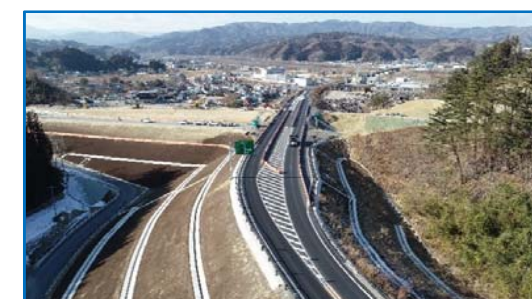
工事完了した(仮)松山IC