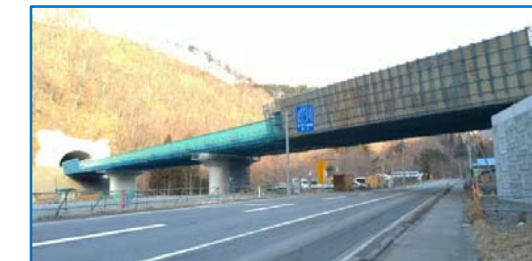
工事完了した上片巣橋