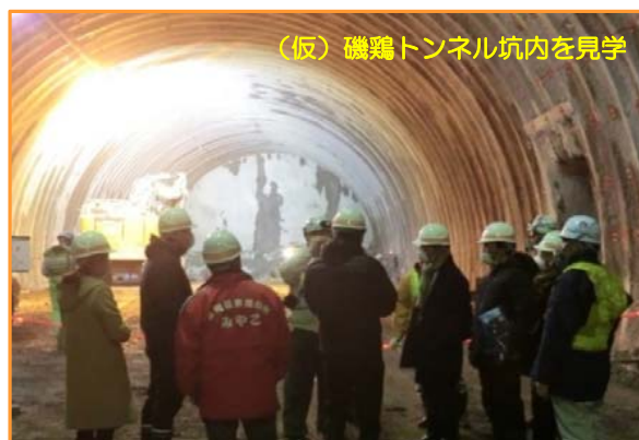
(仮)磯鶏トンネル坑内を見学

1月29日(火) 宮古商工会議所(11名)の皆様が、宮古西道路の現場を見学しました。現在、掘削中の(仮)磯鶏トンネル(磯鶏側：大成建設(株)、小山田側：飛島建設(株))、上部工施工中の(仮)小山田こ道橋((株)富士ピー・エス)の現場を見ていただき、工事の進捗を確認していただきました。