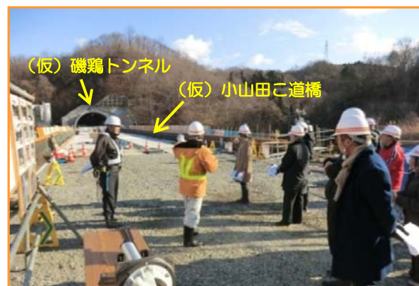
(仮)磯鶏トンネル (仮)小山田こ道橋