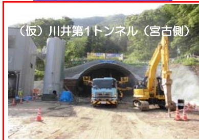
(仮)川井第1トンネル(宮古側)

(仮)川井第1トンネルの掘削を行っています。全長1,764mのうち10mまで進んでいます。