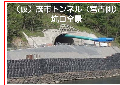
(仮)茂市トンネル(宮古側)坑口全景

(仮)茂市トンネルの掘削を行っています。全長1,885mのうち221mまで進んでいます。