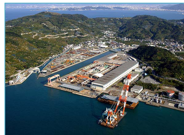
【高田機工(株) 和歌山工場】