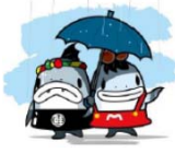
サーモンくん みやこちゃん