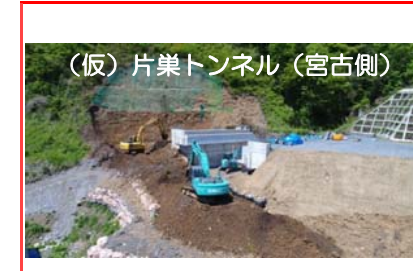
(仮)片巢トンネル(宮古側)