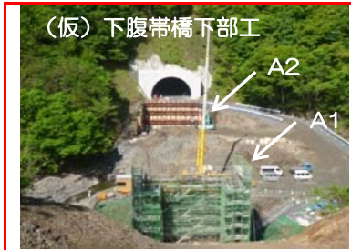
(仮)下腹帯橋下部工

(仮)下腹帯橋A1橋台では、躯体の構築作業を行っています。A2橋台では、土留壁の施工を行っています。