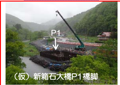
(仮)新箱石大橋P1橋脚