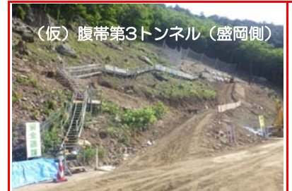
(仮)腹帯第3トンネル(盛岡側)

(仮)下川井トンネルの掘削を行っています。全長2,050mのうち1,096mまで進んでいます。