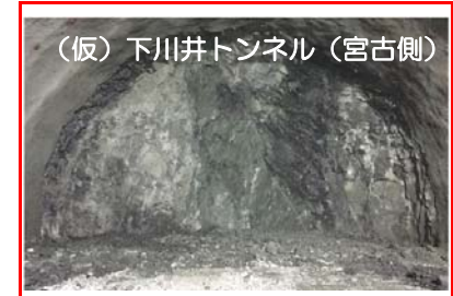
(仮)下川井トンネル(宮古側)

(仮)下川井トンネルの掘削を行っています。全長2,050mのうち1,096mまで進んでいます。