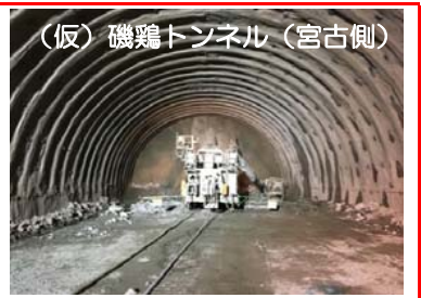
(仮)磯鶏トンネル(宮古側)

(仮)磯鶏トンネル(宮古側)の掘削を行っています。全長1,554m(845mは大豊建設で施工)のうち296mまで進んでいます。