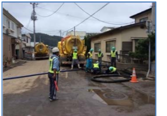
国道106号磯鶏地区道路工事：大成建設(株)

当初は、被災状況が掴めない中、資機材の調達のために関係先へ片っ端から連絡を入れました。また、当工事の現場事務所や労務宿舍も床上浸水の被害にあったため、昼夜通しての復旧作業に携わる労務者とその宿泊先を確保するのに苦労しました。