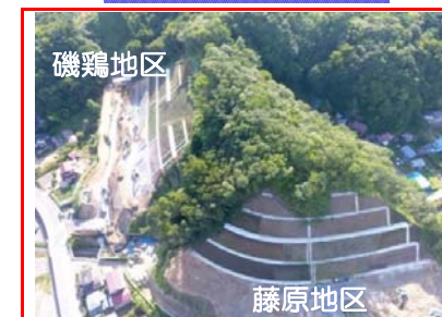
藤原・磯鶏地区で山を掘削して土砂を搬出しています。