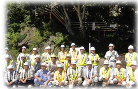
下片巣接続橋上部工工事：オリエンタル白石(株)

担当していた工事の被災の有無に関係なく、宮古箱石道路安全協議会という一つの大きな母体となり、協力しながら短期間で道路啓開作業を進め、各社が集合して通行止め解除を向かえた瞬間は今でも感慨深いものがあります。