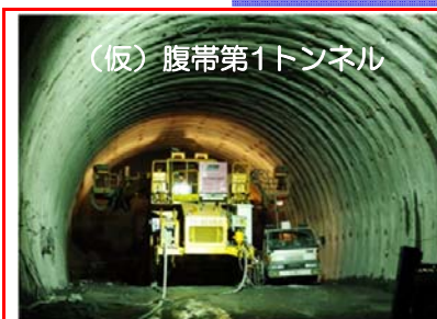
(仮)腹帯第1トンネルを掘るための作業用トンネルを掘削しています。