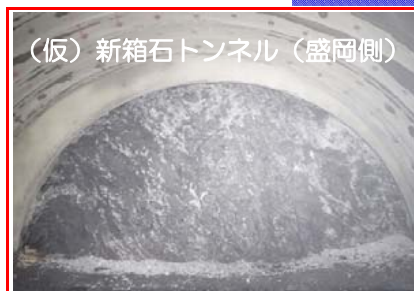
(仮)新箱石トンネルの掘削を行っています。全長1493mのうち1140mまで進んでいます。