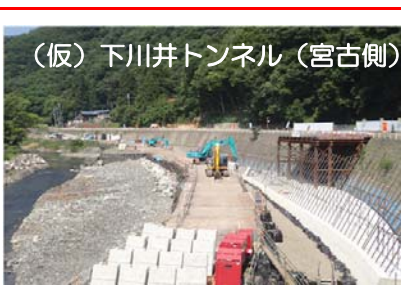
トンネル出口側の古田地区で、国道を切り回すために護岸の拡幅工事を行っています。