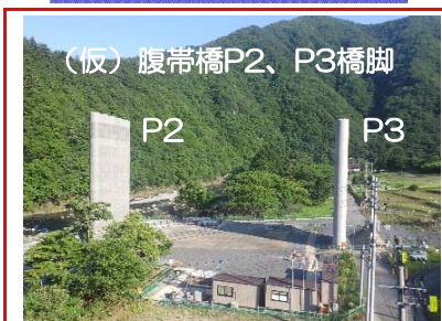
橋脚2基の施工がすべて完了しました。全体の工事は引き続き継続しますので、これからもよろしくお願いいたします。