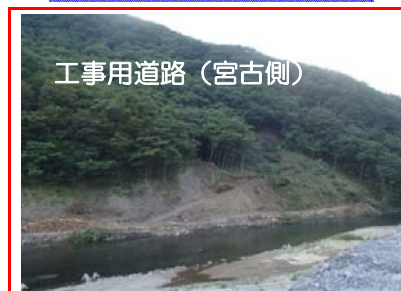
(仮)茂市トンネルを施工するための工事用道路を施工しています。