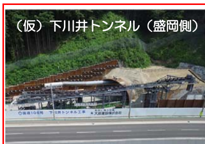
トンネルの掘削した土砂(すり)を坑外へ運搬する設備(連続ベルトコンベアシステム)を設置しました。