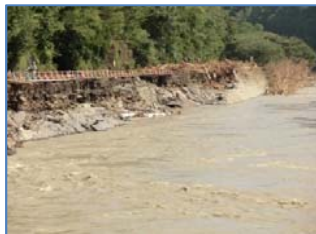
川井箱石地区道路改良工事：(株)浅沼組

箱石地区にて事務所を構えて翌日施工計画書の読み合わせという状況において、台風10号に遭遇し、2日間は106号線が不通となり身動きが取れない状況で、3日に盛岡→釜石→宮古経由で食料と担当者への挨拶を行い、災害復旧作業に参加したのは、発生より5日目からでした。作業内容は、墓目地区での106号線の道路片付け清掃を、5人体制で3日間参加いたしました。清流の綺麗なマイナスイオンに癒される閑伊川が台風の影響で変貌して、多大な被害を起しました。改めて自然の脅威を実感した次第です。建設業マンとして、その地域の地形、土質などから、もし自然災害が起きたらを想定出来る技術者になればと思います。