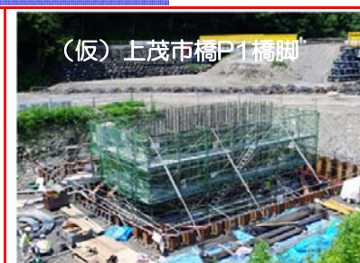
(仮)上茂市橋P1橋脚の柱鉄筋を組み立てています。