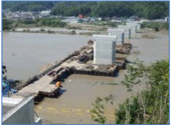
国道45号外 千徳小山田道路工事：前田建設工業(株)

当工事は、その後順調に進み、平成29年3月末に無事完成しましたが、絶対に忘れることのない思い出の一つになりました。