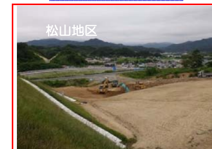
一般国道45号「宮古道路」の切替え工事の後、松山地区の切替工事に着手しています。