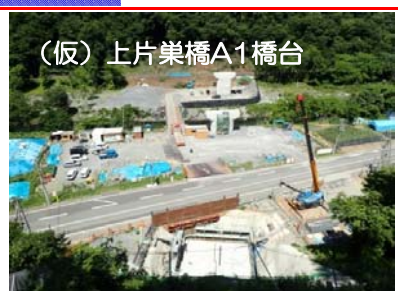
(仮)上片巣橋A1橋台の鉄筋組立を行っています。