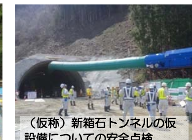
(仮称)新箱石トンネルの仮設備についての安全点検