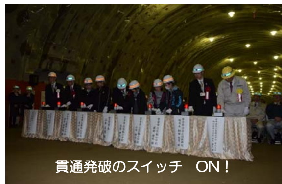
貫通発破のスイッチ ON!