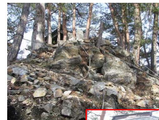
険しい断崖絶壁に建つ”鈴ヶ神社”

冒頭に”ぶらり”と言いましたが、神社は大変険しい断崖絶壁の上にあるため”ぶらり”とは行けません。興味のある方は足元と体力をご確認のうえ、お気をつけていらして下さい。