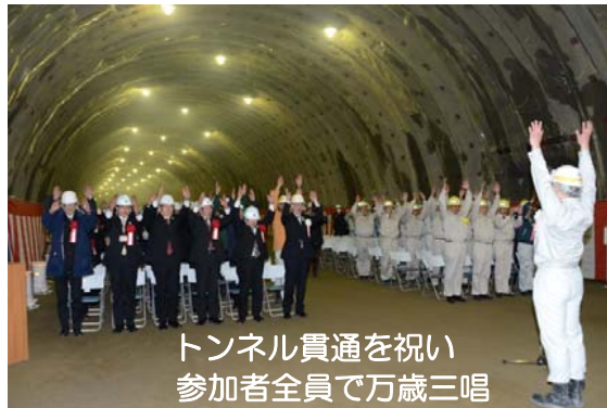
トンネル貫通を祝い参加者全員で万歳三唱