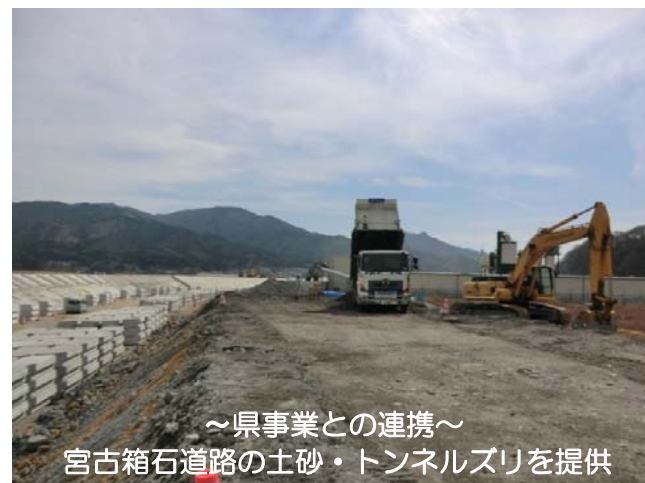
～県事業との連携～ 宮古箱石道路の土砂・トンネルズリを提供