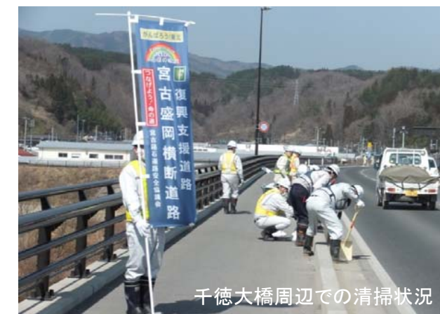
千徳大橋周辺での清掃状況

安全協議会では今後とも定期的に、清掃活動等環境負荷軽減に向けた活動を行うこととしていますので、ご理解ご協力をお願い致します。