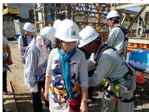
初めて安全帯を着用