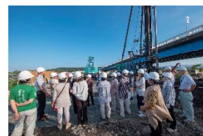
久慈大橋の下部工施工を見学