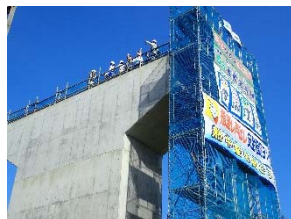
自分の足で地上15mへ到達 請負者から説明を受けました