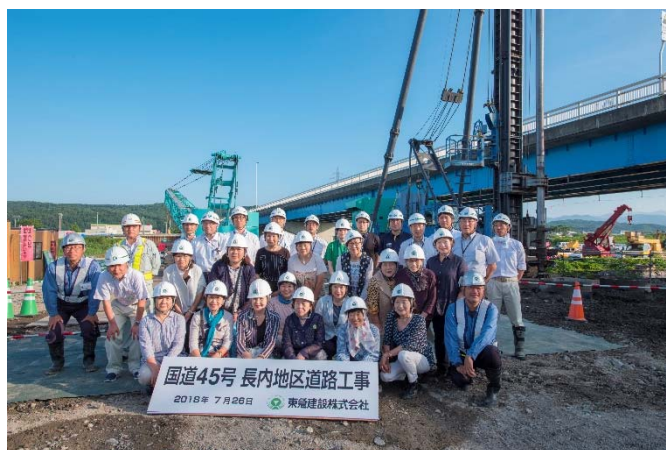
久慈大橋を背景に記念撮影