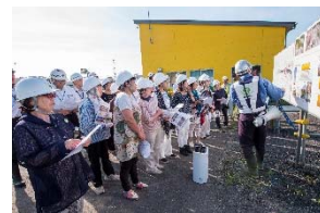
久慈市街地の道路構造について 真剣に説明を聞いています