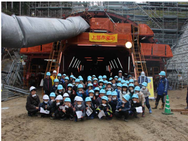
▲山田第2トンネル北側坑口で記念撮影 ありがとう！また来てね！