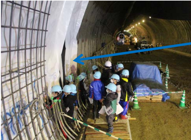
▲トンネル内部の防水シートに名前やイラストを書き込みました