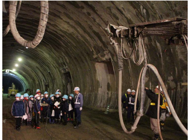
▲トンネルの内壁にコンクリートを吹き付ける大型機械の遠隔操作を体験