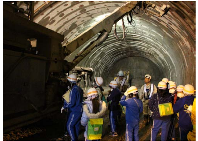
▲トンネル工事で活躍する大型機械を間近に見て大興奮！