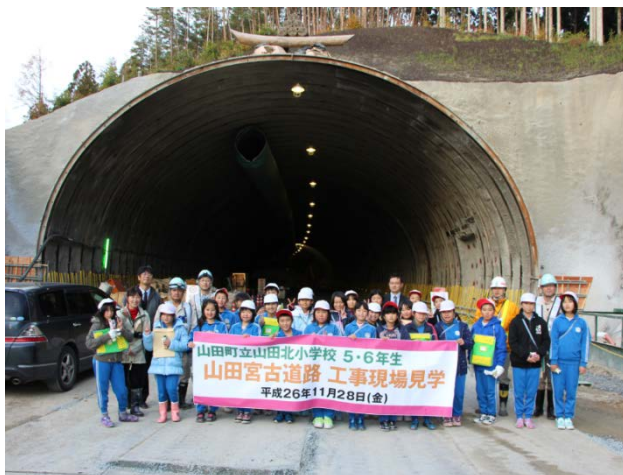
▲山田第1トンネル南側坑口で記念撮影 ありがとう！また来てね！

参加した生徒の皆さんからは、 Q：火薬を使うときはこわくないですか？ A：最近の技術の進歩により、決められたルール通りに使えば危なくないよう安全につくられています など積極的に質問があり、トンネル工事に関心を深めた様子で、大変有意義な見学会となりました。 三陸国道事務所では、地域の小中学校が行う「総合的な学習の時間」の授業に対し、より実践的な学習ができるよう、現場見学や各種施設の見学会、出張出前講座などを通じた協力を行っています。くわしくは、 三陸国道事務所 地域づくり相談室 0193-71-1711 までお気軽に。