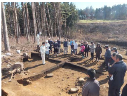
▲地元住民の方々興味深そうに説明に耳を傾けていました