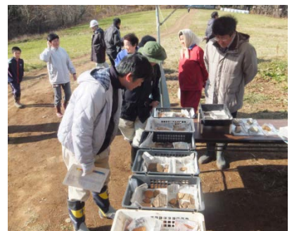
▲出土した土器を見ながら太古の昔に想いを馳せていました