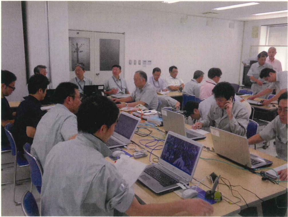
【被災情報収集状況】