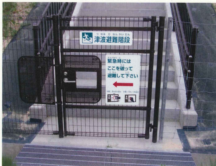
【写真】津波避難階段 進入扉