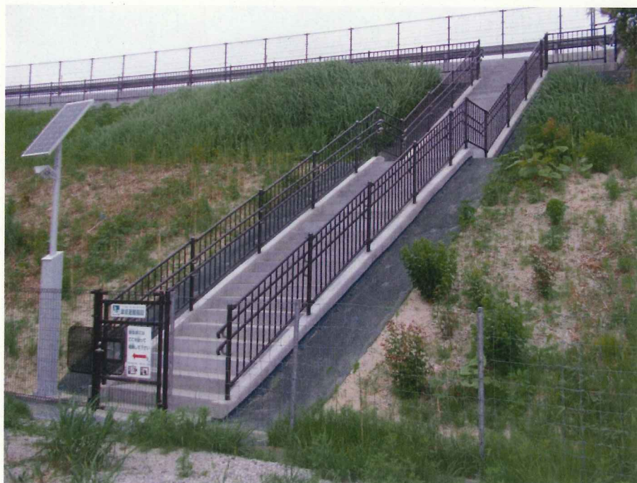
【写真】津波避難階段（全景）