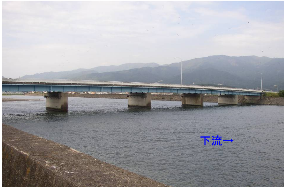
▲震災前の気仙大橋