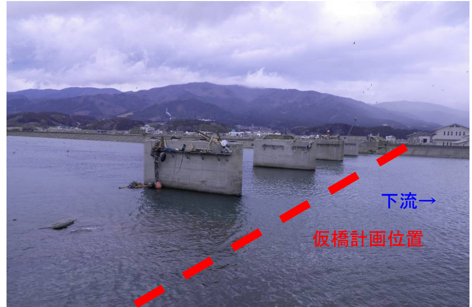
▲震災後の気仙大橋(上部工流出)