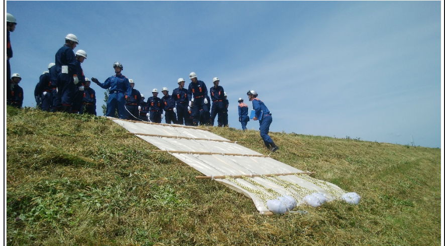
▲シート張り工法の実践の様子