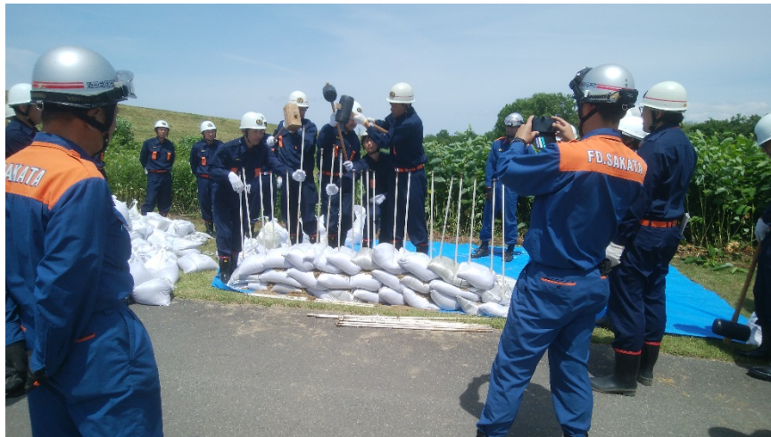
▲積み土のう工法の実践の様子