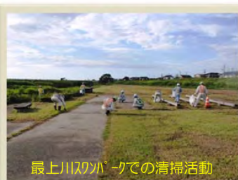
最上川スワンパークでの清掃活動

その活動の一環として、芋煮会などで河川の利用が多くなる時期を前にした8月29日(金)に、最上川スワンパークと清川河川公園において、会員による清掃活動が行われました。