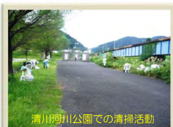
清川河川公園での清掃活動