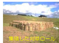
集積した刈草ロール

年2回実施している堤防除草で発生する刈草について、今年2回目の無償提供を開始しましたので、希望される方は酒田出張所までご連絡願います。