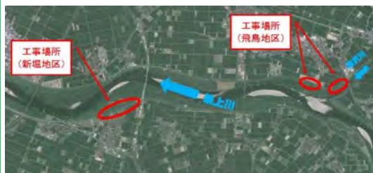
【浸透対策(止水矢板)イメージ】

工事は、堤防と川の間止水矢板を打ち込む工法を採用し、12月下旬までに完成させる予定です。工事期間中は、工事車両の通行などで、堤防上は通行しにくくなる場合がありますので、河川空間を利用される場合を除く車両の通行は、ご遠慮いただきますように、ご協力お願いいたします。