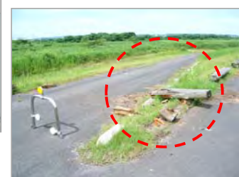
車止めが損傷している様子