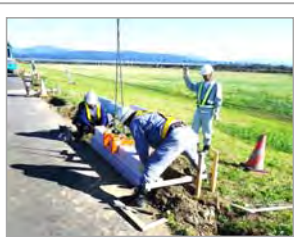
車止めを交換している様子

最上川左岸の酒田市下瀬から砂越にかけての約7km区間の堤防には、勾配が緩やかになっている箇所があります。この範囲には、堤防に車両が乗り入れできないように、木製の車止めが設置されていましたが、長期間にわたる風雪に耐えきれず、木材が朽ちたり、鉄筋が露出するなど、危険な状態になったことから、全てをコンクリート製ブロックの車止めに交換しました。