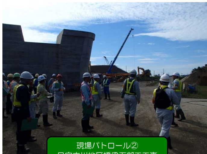
現場パトロール② 日向古川地区橋梁下部工工事