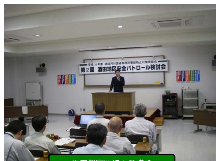
酒田警察署による講話

国道7号酒田市、遊佐町・47号酒田市、庄内町に関するお問い合わせは、国土交通省 酒田国道維持出張所 までお願いします。