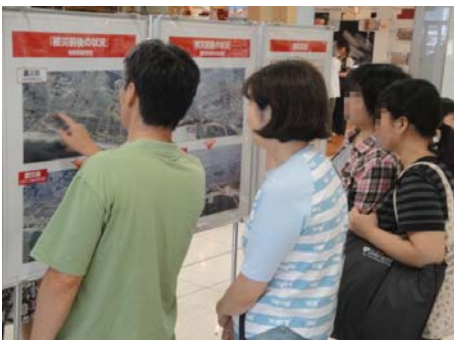
▲多くの方が真剣にパネルをのぞき込む