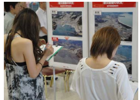
▲若い方も多数来場