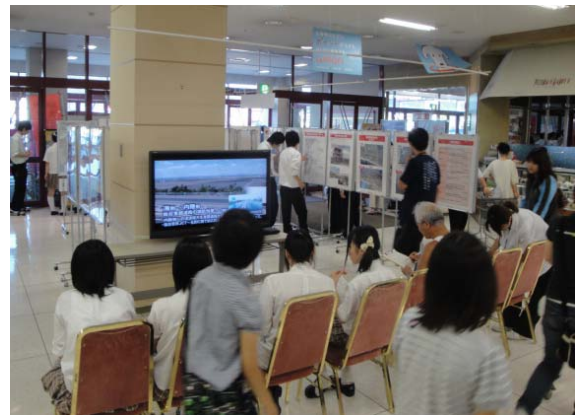
▲ビデオ上映コーナー