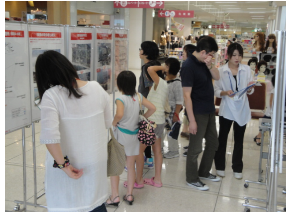
▲多くの方に来場いただいた

世代を問わず多くの方々に来場していただいた。また、真剣にパネルをのぞき込む姿が多く、アンケート調査にも協力的であった。