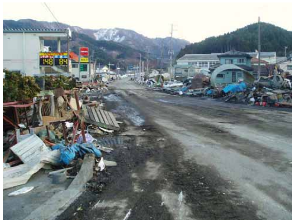
▲大船渡市方面を撮影