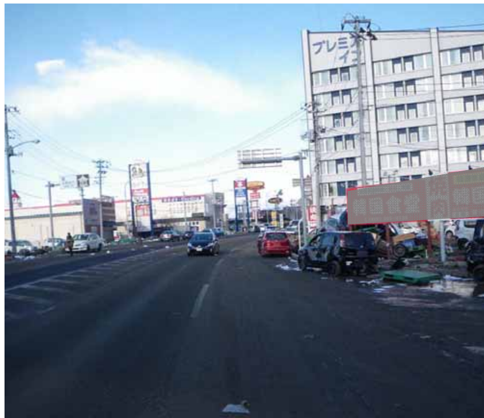
▲多賀城市方面を撮影