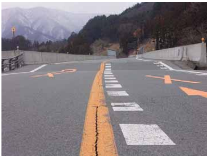
▲釜石市方面を撮影