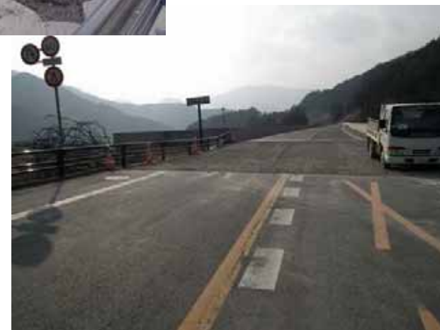
▲遠野市方面を撮影