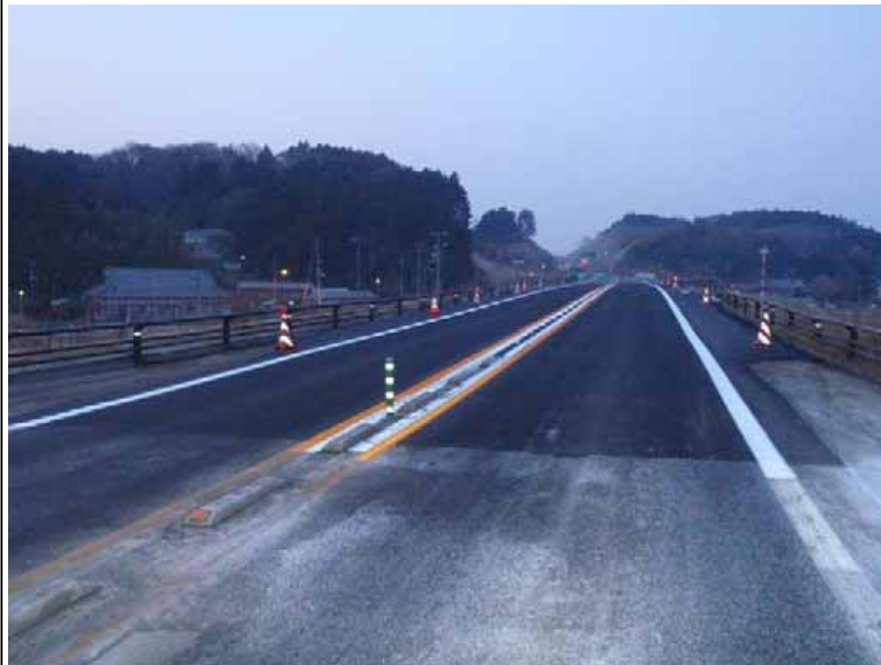
▲仙台市方面を撮影