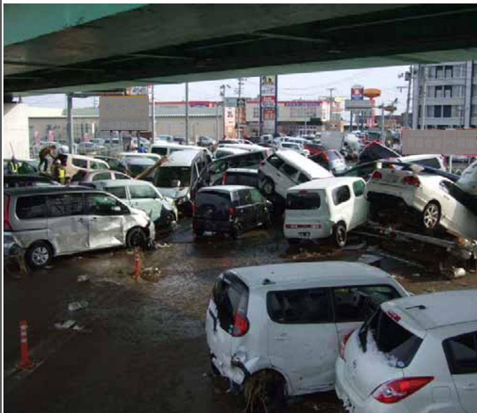
▲多賀城市方面を撮影