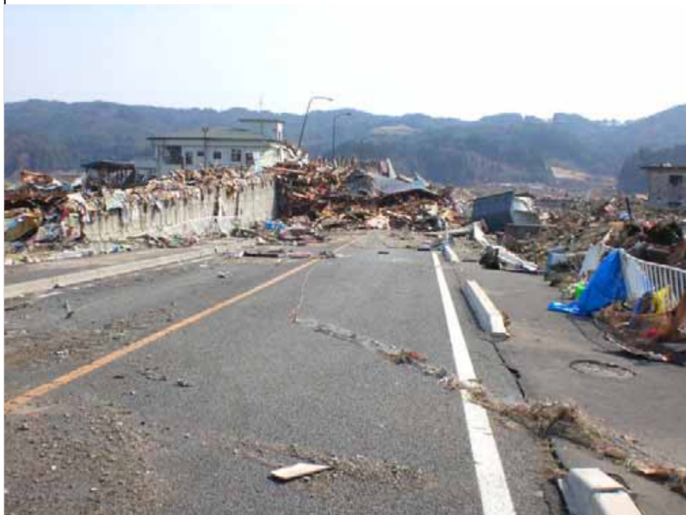
▲大槌町内方面を撮影