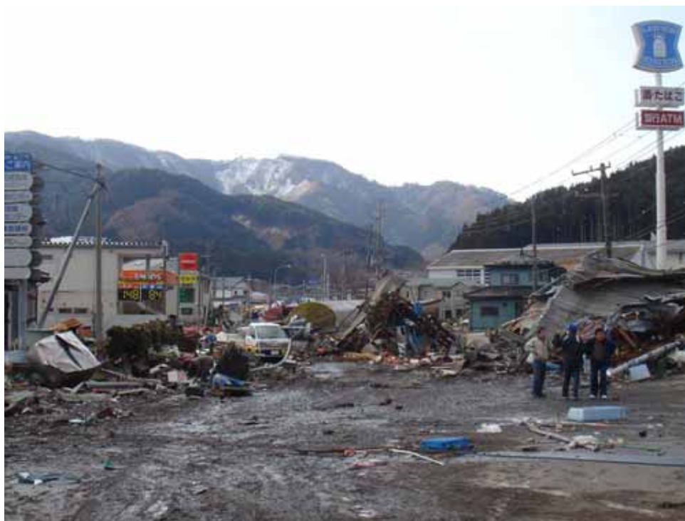
▲大船渡市方面を撮影