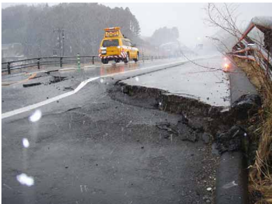
▲仙台市方面を撮影