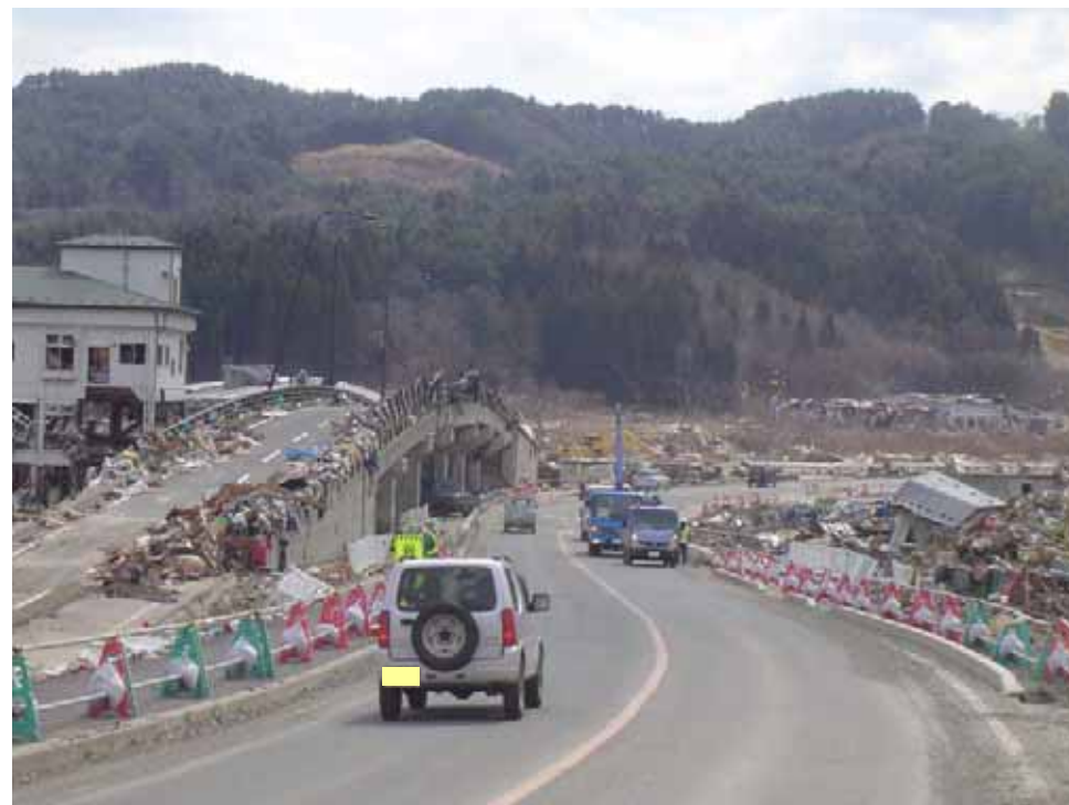
▲大槌町内方面を撮影