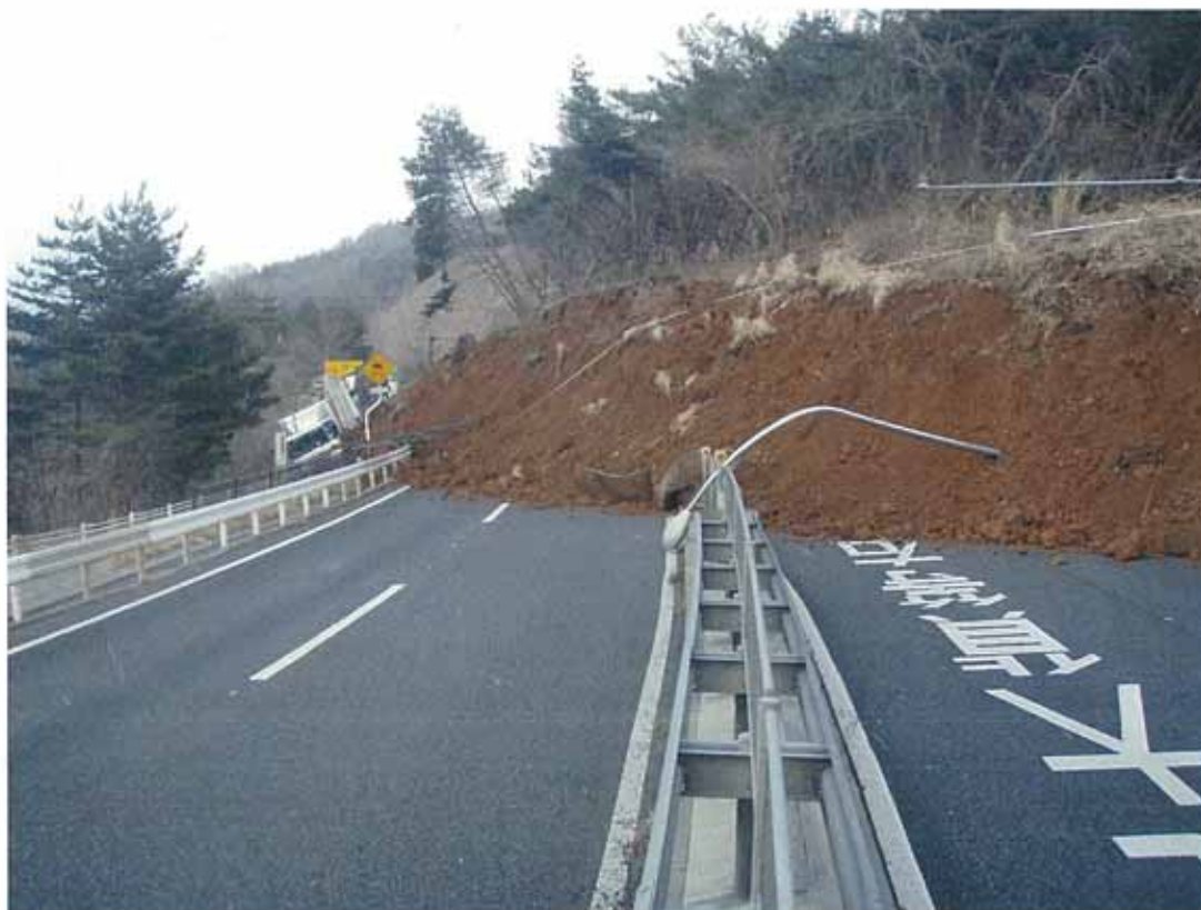
⑭国道6号 路面崩壊（福島県広野町）