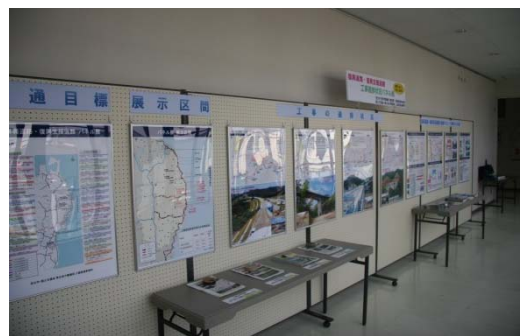
▲パネル展示状況 (キャトル宮古)