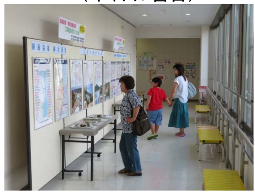
▲パネル展開催状況(道の駅みやこ・キャトル宮古)