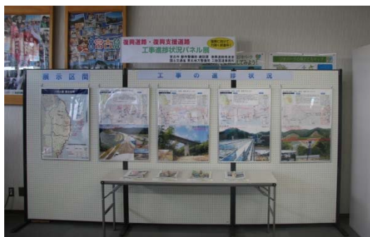
▲パネル展示状況 (道の駅みやこ)

聞き取り実施者211名のうち、187名(約9割)が「良い取り組みである」と評価 「復興の進展がわかるので良い」 「帰る度に、着実に復興を見て取れてうれしい」 「道路をつくったことによる効果がわかった」 「この時期にやっていてくれて良かった」等の意見がありました。