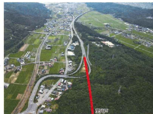
久慈北IC付近から久慈道路を望む