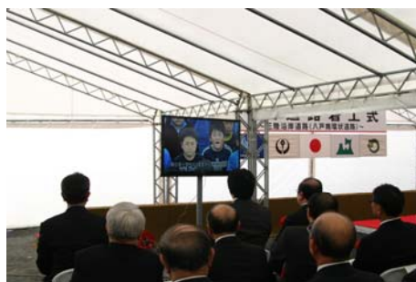
▲ビデオレター上映