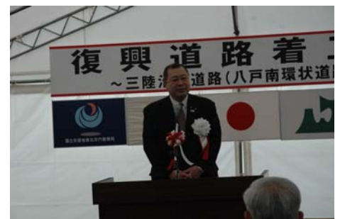
▲挨拶(国土交通省津島大臣政務官)