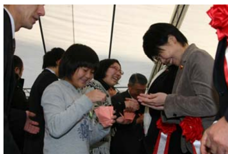
▲「命の道バッチ」贈呈