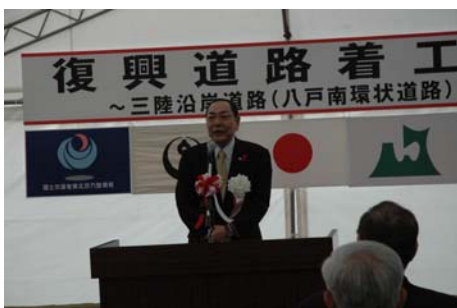
▲挨拶(青森県青山副知事)