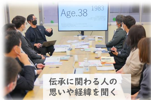
伝承に関わる人の 思いや経緯を聞く