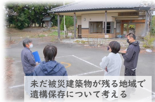
未だ被災建築物が残る地域で 遺構保存について考える