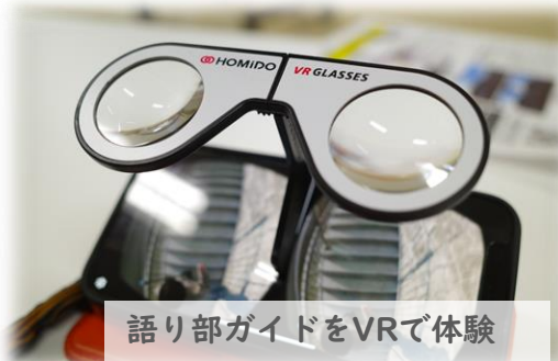
語り部ガイドをVRで体験