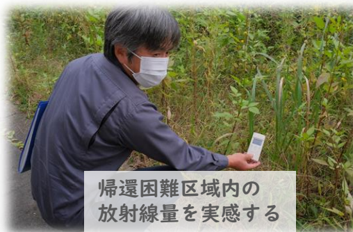
帰還困難区域内の 放射線量を実感する