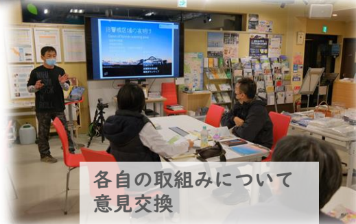
各自の取組みについて 意見交換