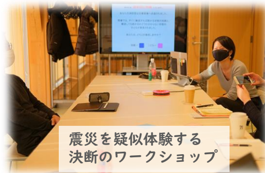
震災を疑似体験する 決断のワークショップ