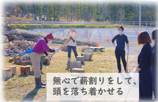
無心で薪割りをして、頭を落ち着かせる