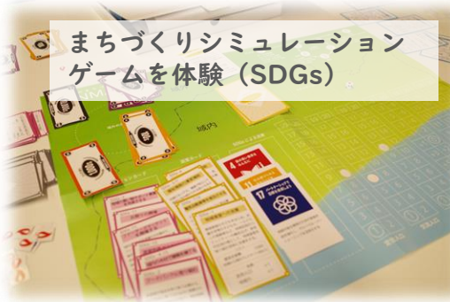
まちづくりシミュレーション ゲームを体験 (SDGs)