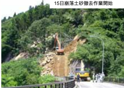
15日前落土砂撤去作業開始

いちのせきしげんびちょう 国道342号 岩手県一関市巖美町内 [矢びつダム付近の土砂崩落]