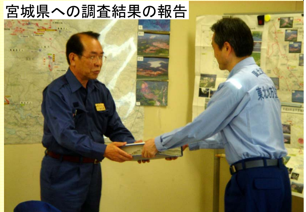
宮城県への調査結果の報告