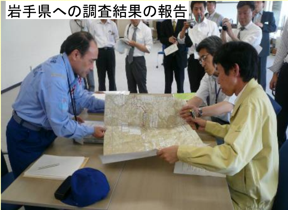
岩手県への調査結果の報告