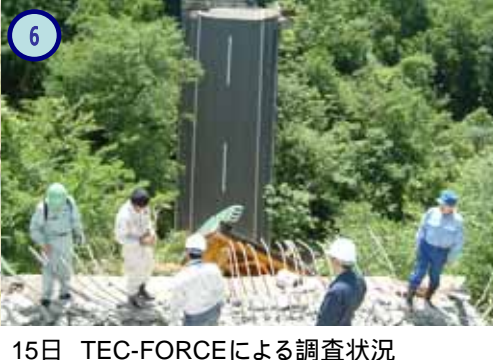
15日 TEC-FORCEによる調査状況

いちのせきしげんびちょう 国道342号 岩手県一関市巖美町内 【矢びつダム付近の土砂崩落】