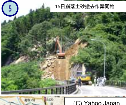
15日崩落土砂撤去作業開始

いちのせきしげんびちょう 国道342号 岩手県一関市巖美町内 【矢びつダム付近の土砂崩落】