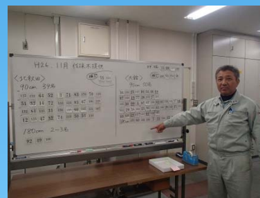
↑ 出張所長による抽選状況(くじを引いて→貼って→完成)