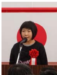
▲地元代表メッセージ