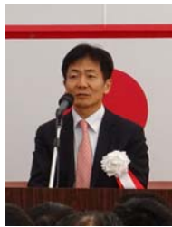
▲石川道路局長挨拶