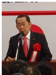
▲金田衆議院議員祝辞