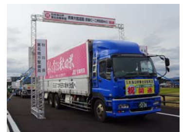
▲開通式パレードの様子