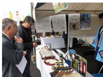
▲地域の特産品ブースの様子