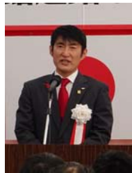
▲福原大館市長挨拶