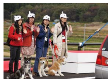
▲秋田犬によるパレード見送りの様子