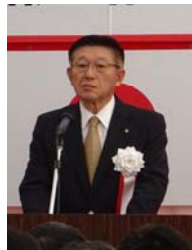
▲佐竹秋田県知事挨拶