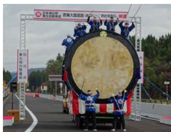
▲綴子大太鼓披露の様子