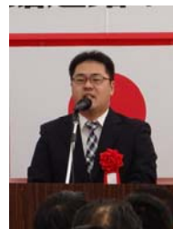
▲地元代表メッセージ