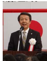
▲津谷北秋田市長挨拶