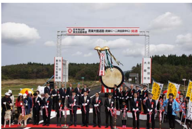
▲テープカット・くす玉開披