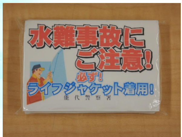
【警察署で配布したティッシュ】