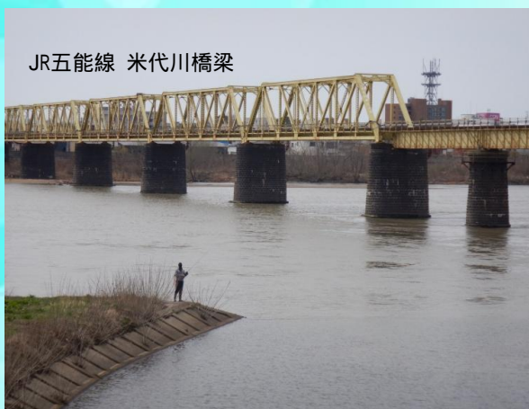
【川に入れず岸から竿を垂らす釣り人】