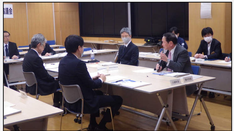
委員（能代市長）からの意見